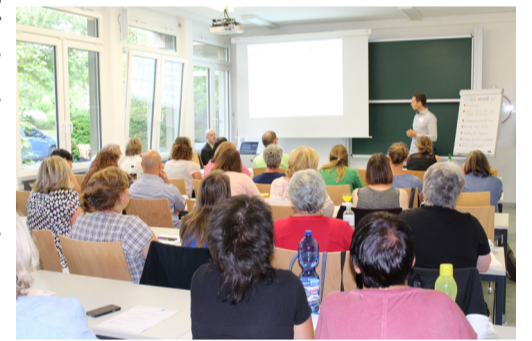
QiD-Werkstatt, Koblenz.

Im Sinne der Nachhaltigkeit fand am 7. Juni 2017 das zweite Treffen der Prozessbegleiter*innen von Qualitätsentwicklung im Diskurs statt. Am 13. Juni 2017 wurde darüber hinaus die erste QiD-Werkstatt im IBEB durchgeführt. Dieses Format dient der Information und dem Austausch der mit Qualitätsentwicklung im Diskurs zertifizierten Kindertageseinrichtungen und ist zudem ein Bestandteil der Folgezertifizierung. Am 7. September 2017 folgte das erste Kooperationstreffen mit den Fachberater*innen jener Regionen, in welchen Kindertageseinrichtungen mit dem Ansatz arbeiten.