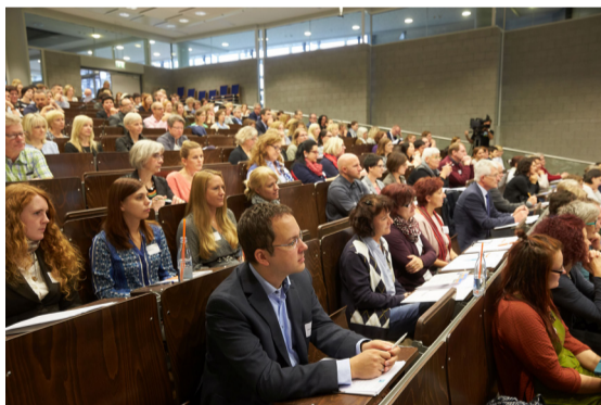
III. KiTa-Kongress 2017.