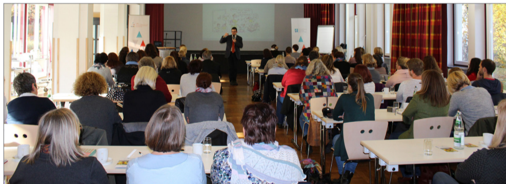
QiD-Fachtag, Bad Dürkheim.