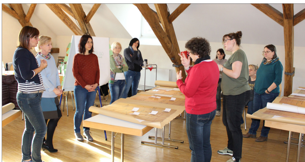
QID-Regionalgruppentreffen, Neuwied.

Nach der Entwicklung des Ansatzes sind inzwischen 49 Kindertageseinrichtungen aus den Regionen Bad Kreuznach, Bitburg-Prüm, Koblenz, Mayen-Koblenz, Neuwied, Rhein-Hunsrück-Kreis, Südliche Weinstraße, Speyer und Westerwaldkreis mit Qualitätsentwicklung im Diskurs zertifiziert (Stand: Januar 2018).