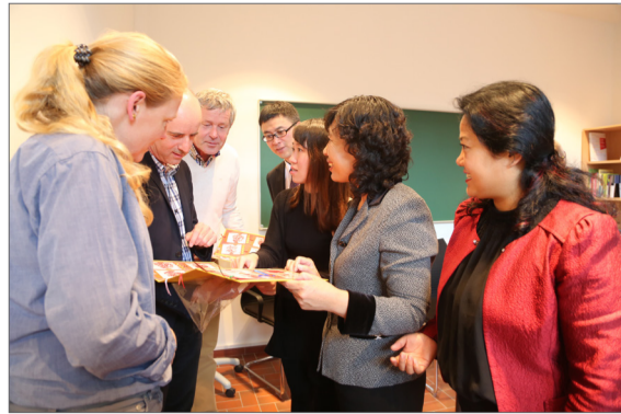
Austausch zwischen IBEB und China-Delegation.

Die Fachpersonen informierten sich über die zahlreichen