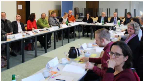
IBEB-Diskursforum Kita-Finanzierung, Koblenz.

Am 12. November 2017 fand das IBEB-Diskursforum zum Thema „Kita-Finanzierung in Rheinland-Pfalz - Konsequenzen aus dem Kommunalbericht 2017 des Rechnungshofes“ statt. Dies zeigte die unterschiedlichen Perspektiven und die Komplexität des Systems Kindertagesbetreuung auf und bot einen differenzierten Austausch der verschiedenen Blickrichtungen auf den Kommunalbericht. Vertreter*innen der kommunalen und freien Träger, des Landkreistages sowie des Gemeinde- und Städtebundes, der Wissenschaft, des Landesjugendamtes und des Ministeriums für Bildung waren an diesem IBEB-Diskursforum beteiligt. Zunächst gab der Präsident des Rechnungshofes, Jörg Berres, Einblicke in die Intentionen und die Entstehung des Kommunalberichtes, insbesondere des Prüfbereiches Kindertagesstätten. Nach seinem Vortrag brachte Dr. Christiane Meiner-Teubner (Forschungsverbund DJI/TU Dortmund, Arbeitsstelle Kinder- und Jugendhilfestatistik) weitere Impulse aus ihrer fachlichen Expertise ein.