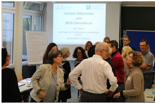
IBEB-Diskursforum Fachberatung, Koblenz.

lichkeit des fachlichen Diskurses. Hierbei wurde das genannte Thema von verschiedenen Standpunkten aus dem Feld