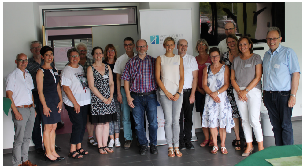
IBEB-Diskursforum Trägerstrukturen, Linkenbach.

Am 22. Juni 2017 fand das IBEB-Diskursforum zum Thema „Trägerstrukturen von Kindertageseinrichtungen“ in Linkenbach (Westerwald) statt.