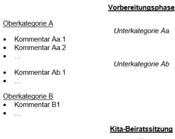
Grafik 2: Kategorisierungsmuster (eigene Darstellung)

jede Interessengruppe wurde eine eigene Textdatei erstellt. Grobe Rechtschreib- und Zeichensetzungsfehler sind der besseren Lesbarkeit wegen korrigiert worden. Sofern in einem Kommentar mehrere, unzusammenhängende Ideen aufgezählt wurden, wurden diese einzeln gespeichert. In einem nächsten Schritt wurde eine Kategorisierung der Beiträge vorgenommen. Dazu sind Oberkategorien innerhalb der Phasen erstellt worden. Sofern eine feinere Untergliederung sinnvoll erschien, wurden zusätzlich Unterkategorien eingefügt. Die Oberkategorien haben Überschriften, welche die ihnen folgenden Kommentare thematisch zusammenfassen. Die Titel der Unterkategorien stehen für eine Unterscheidung innerhalb der Oberkategoriengruppe. Die folgende Grafik zeigt musterhaft, wie die Kategorisierung der Dokumentationen aufgebaut ist.