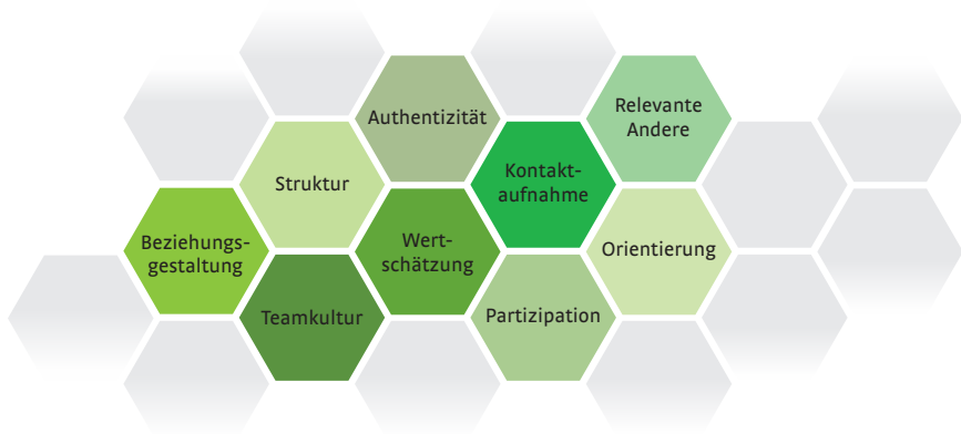
Abbildung 3: Neun Bausteine guter Praxis